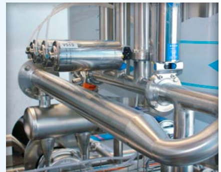
Alle Prozessanlagen sind zwecks optimaler Reinigungsfähigkeit in Chromnickelstahl ausgeführt.