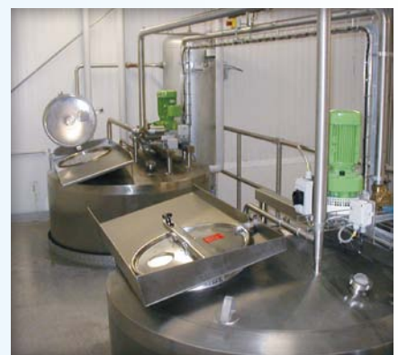
Um eine angenehme und einfache Arbeit zu gewährleisten, berücksichtigen wir bei allen Konstruktionen auch die Ergonomie.