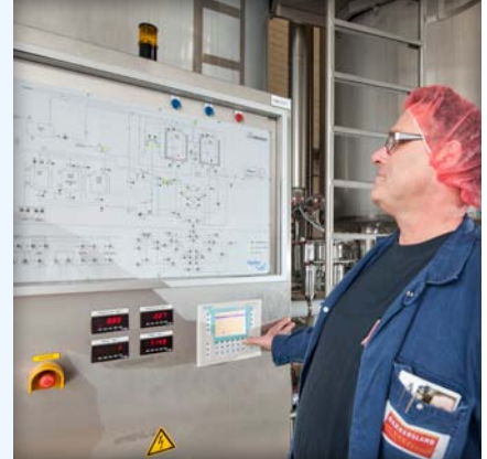
Dank Automatisierung verläuft der Prozess schneller, kostengünstiger und immer identisch.

Außerdem werden alle Zutaten optimal dosiert, sodass keine Zutat vergessen werden kann und Ausschuss beim Herstellungsverfahren vermieden wird.